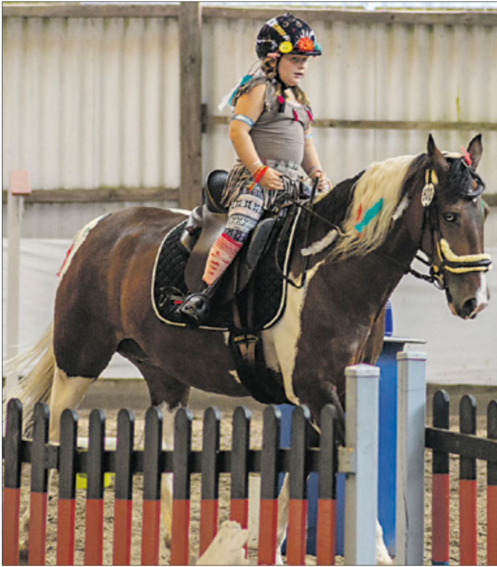
Großen Zuspruch gab es in den Einsteigerklassen.