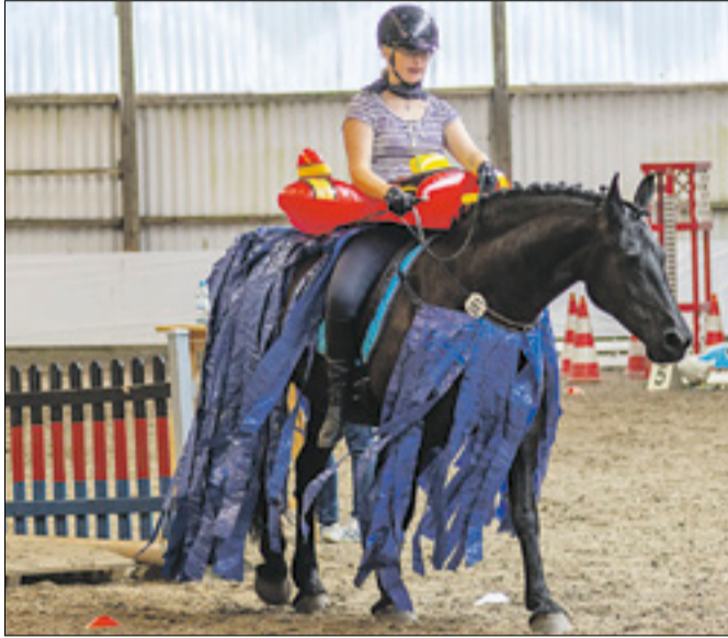
Auch ausgefallene Verkleidungen gehörten dazu.